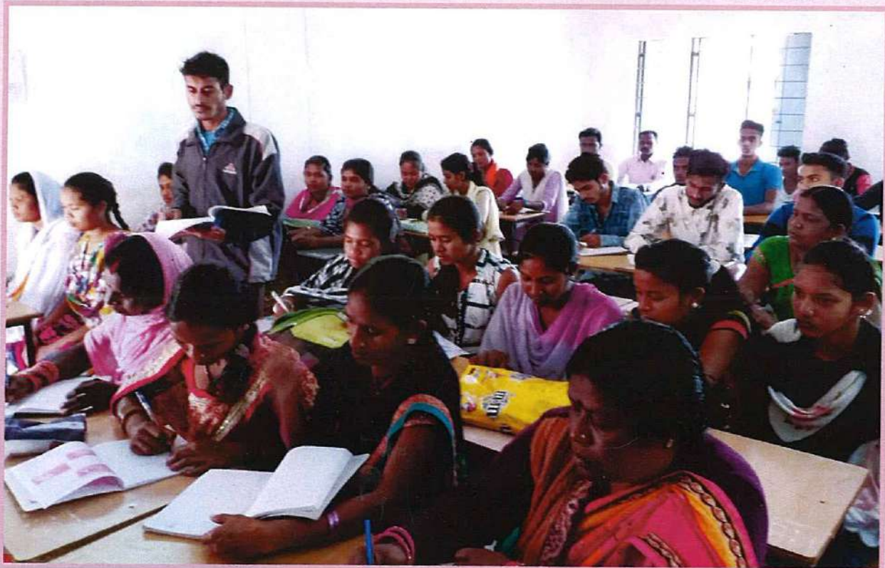
छत्तीसगढ़ राज्य ओपन स्कूल, रायपुर द्वारा आयोजित परीक्षाओं के लिए अवकाश अवधि में 1 लाख से अधिक परीक्षार्थियों के लिए संपर्क कक्षाएं आयोजित की जाती हैं।