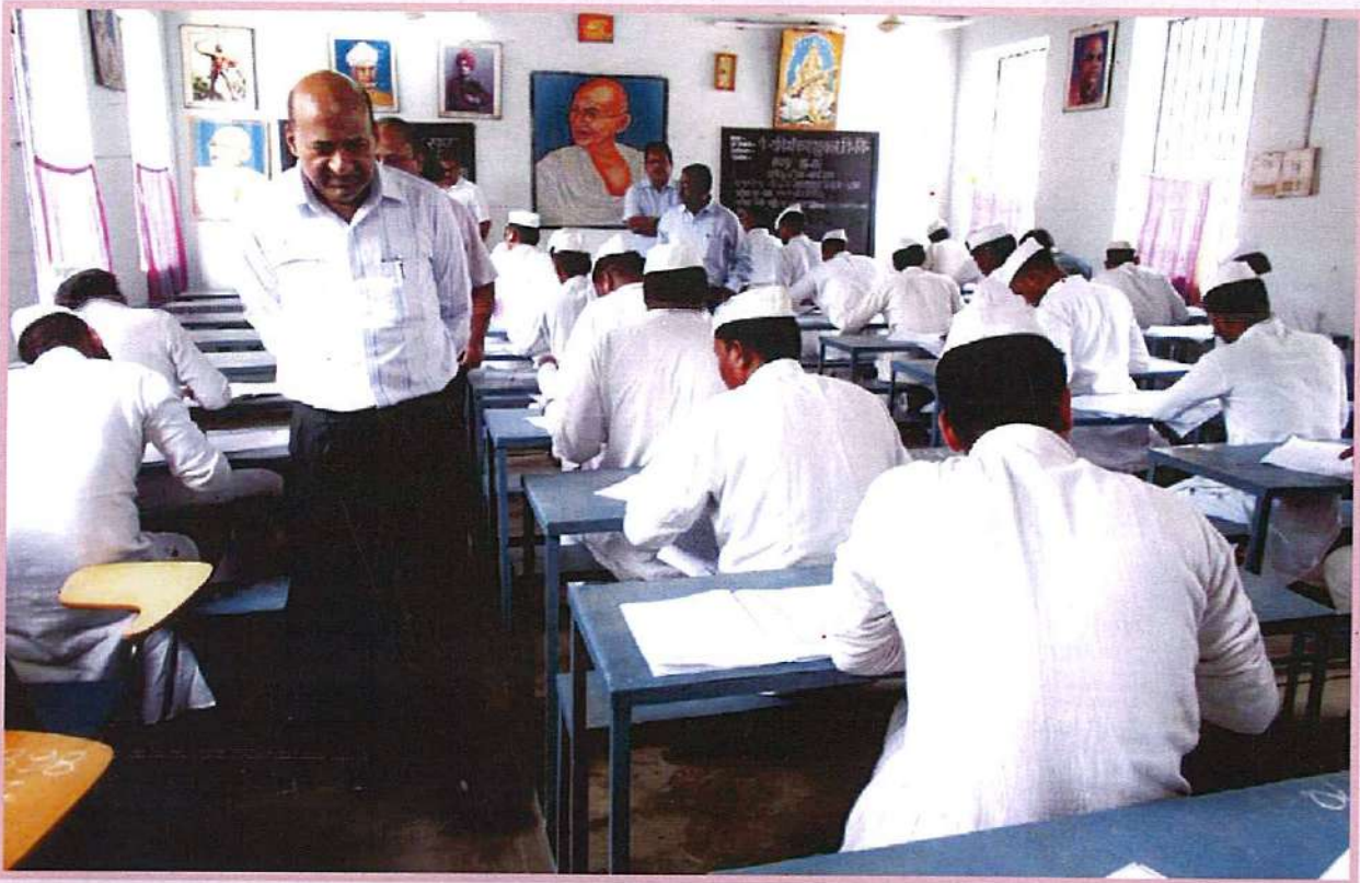
छत्तीसगढ़ राज्य ओपन स्कूल, रायपुर द्वारा नई पहल करते हुए केंद्रीय जेल रायपुर में बंदियों को हाईस्कूल एवं हायर सेकण्डरी की परीक्षा जेल परिसर में ही अयोजित की जा रही है।